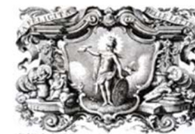
Società Italiana di Studi sul Secolo XVIII