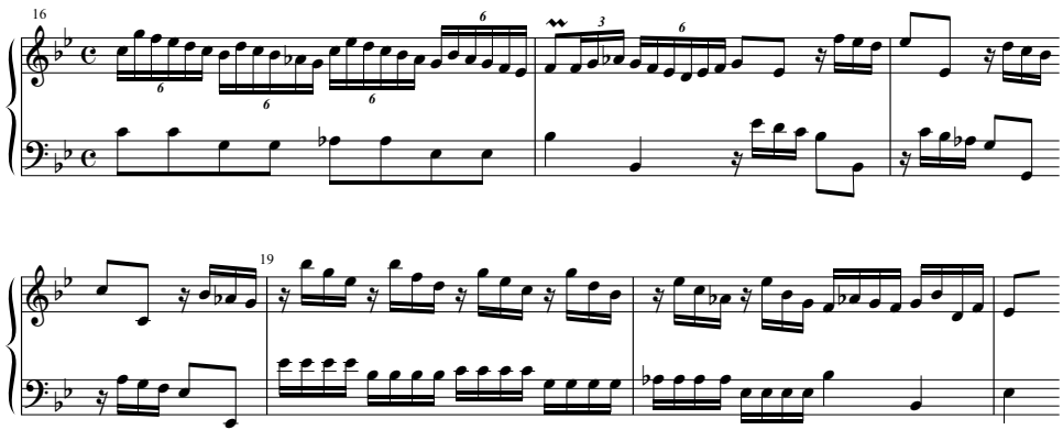
Beispiel 7: Francesco Durante, Perfidia-Sonate, T. 16–19

Bei den triolischen Bewegungen (T. 16) und den gebrochenen Akkorden im nachfolgenden Notenbeispiel (T. 18 und 19) handelt es sich demgegenüber um weitgehend standardisierte, schematische Diminutionstechniken.