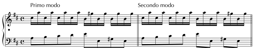
Beispiel 8: Francesco Durante, Regole e Partimenti , »Diminuiti«, Ausführungsbeispiele Gj 7

Einige kompositorische Elemente in der Ausführung der Perfidia-Sonate finden sich auch im dritten Teil des Partimento-Kompandiums (»Diminuiti«). Das folgende Beispiel zeigt im Secondo modo eine variierte Form des Perfidia-Basses.